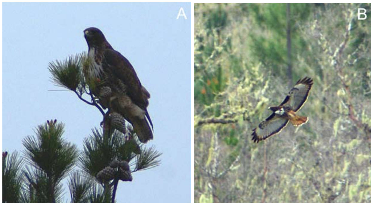
Figura 4. Hembra adulta de aguilucho de cola rojiza ( Buteo ventralis ) observada en septiembre de 2011 en un sitio de nidificación situado en un remanente de bosque Maulino costero cerca de Cauquenes. (A) hembra sobre la punta de un pino cerca del nido, (B) hembra en vuelo con vista ventral.

actividad de la especie y nuestra capacidad de detectarla.