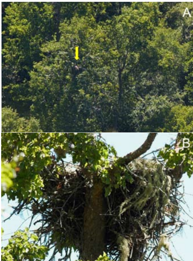
Figura 3. Nido de aguilucho de cola rojiza ( Buteo ventralis ) sobre un hualo adulto ( Lophozonia glauca ) registrado en septiembre de 2011 dentro de un remanente de bosque maulino costero en la cordillera de Cauquenes. (A) vista panorámica de la ubicación del nido, (B) vista cercana de la plataforma de anidamiento.

Sin embargo, esto último también puede afectarla negativamente ya que en las áreas abiertas son más vulnerables a la persecución humana (Rivas-Fuenzalida et al. 2011).